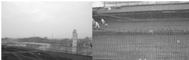
图1 超长预应力管道示意图

我国的桥梁技术发展在近20年来达到了飞越式的发展境界,正以它的品牌走向世界。随着国内不断挑战桥梁大跨径的极限,给我们的施工技术人员带来更大、更艰巨的施工技术挑战。目前桥梁的上构主体施工基本为预应力砼结构,众所周知,预应力砼施工分为先张和后张法两种施工方法,而后张法广泛用于大跨径的预应力桥施工。跨径在增大,预应力筋的埋设跟着加长,超过一定长度之后会对我们的施工质量造成致命的危害。当预应力管道长度 L \geq 100\text{m} 时,可视为超长预应力管道,如下图所示。若管道压浆施工方法还如传统的方式,那么桥梁的质量能否满足规范要求就不得不打问号了。在实际施工过程中,