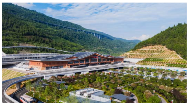
图1 巴东站站房与自然环境

宏观角度,巴东县地貌旖旎,长江和清江自西向东贯穿境内;微观角度,站房背靠山体,面向水面。故站房从“师法自然,写意山水”的设计思路出发,屋面由几组坡屋面构成,高低错落,