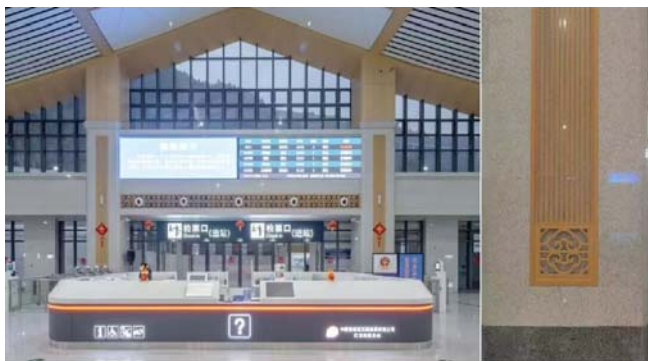
图3 西兰卡普纹样提取

作为最能代表民族文化元素的“西兰卡普”经典铺盖纹样,通过抽象简约再创作之后,以菱形图案为基本构成形式,以阴刻铝板的方式呈现在候车厅吊顶正中区域、综合服务中心背景墙等区域(图4),且与整个候车大厅整体现代简洁的风格相一致。