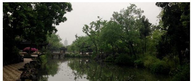
拙政园远借北报恩寺塔

的意境。拙政园对借景等手法的使用,不仅将优美环境引入园林内部,变相增加空间景观层次,同时也突出闹市中如世外桃源般内敛含蓄的空间意境。